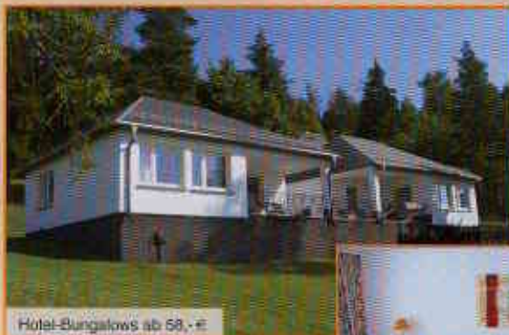
Hotel-Bungalows ab 58,- €

Alle Zimmer- und Angebotspreise verstehen sich zzgl. des Kurbeitrages von -,50 € pro Person und Tag (Kinder -,30 €/Tag).