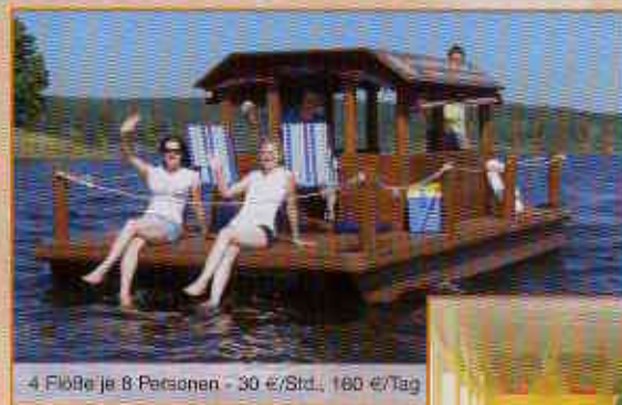
4 Plätze je 8 Personen - 30 €/Std., 160 €/Tag